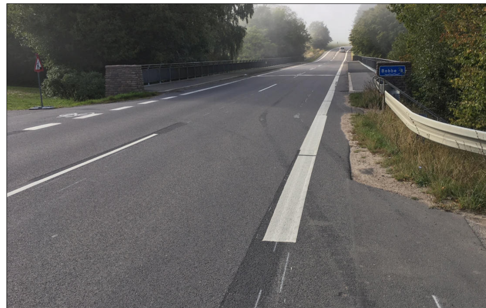
Broen over Bobbe Å (kantstenen er efterfølgende blevet malet hvid)

Se mere om løbet på www.cykelbornholm rundt.dk