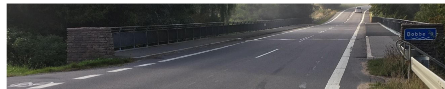
Kantstenen er efterfølgende blevet malet hvid

Men i virkelighedens verden er der ikke plads til to cyklister i hver side, da kantbanernes bredde på 150 cm omfatter den brede stribe mellem bilkørebane og cykelkantbane og derfor reelt kun er 120 cm bred.